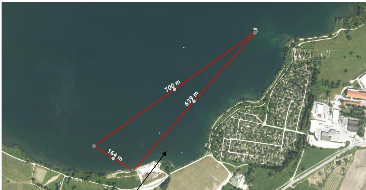
Območje za razplavanje